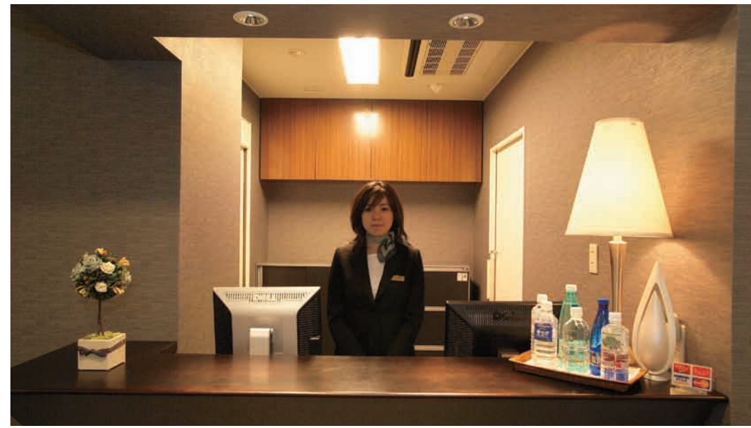
3Fの会員専用エントランス

検査を受けた後、念のために期間をおいて再撮影が必要になった場合については、再検査料は無料となる。こうした面でサポートが受けられるのも嬉しい限りだ。 さて、がん細胞というのは多くの場合、体内で1センチくらいのおおきさなるまでに長い年数がかかるもの。1センチ以上の大きさになると急激に増殖し、治療率が低下。手遅れになってしまうケースも少なくないという。同クリニックに導入されているPET-CTは、高精度な画像分解ができるTrueXを搭載しているため1センチ以下の急増殖前のがん細胞でも発見可能。PET-CT検査を年に1回、定期的に受ければ仮にがん細胞があっても小さなうちに発見でき、早期治療、完治が容易となる。 しかも、従来のがん検査は部位ごとに分かれ、多くの時間や苦痛が伴っていたが、PET-CT検査なら、痛みもなく全身を一度に撮影できるという大きなメリットがある。 「まずは健康を保つ」これは経営者であればもちろんだが、人生を楽しむための重要なファクターである。体は買い換えることが出来ない、日頃から細やかなメンテナンスを心がけたいものである。 健診医療がここまで進歩した今だからこそあわただしい日常から離れ、今一度、自分自身をみつめなおすために名古屋へ足をのばして、贅沢な健診を受けてみてはいかがだろう。